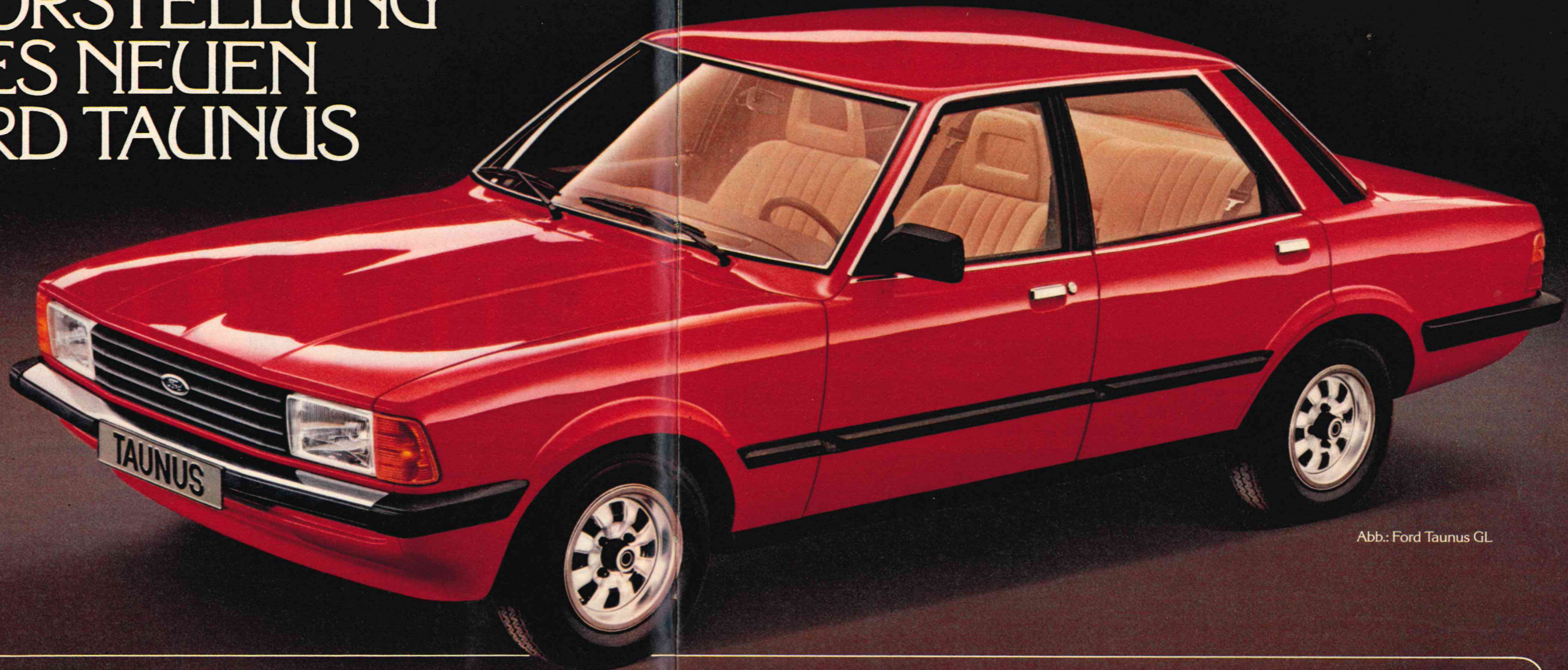
Abb.: Ford Taunus GL